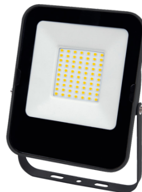
ALFA SMD 50W