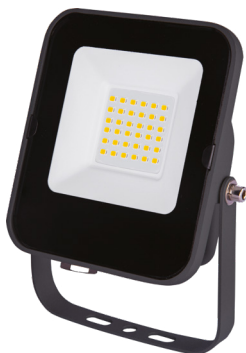
ALFA SMD 20W