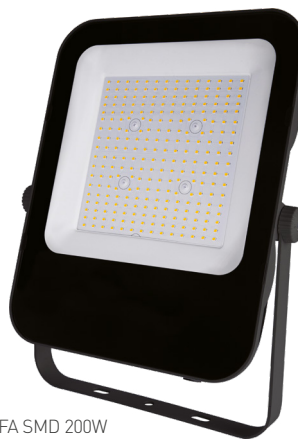
ALFA SMD 200W