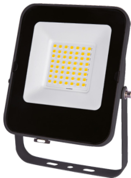
ALFA SMD 30W