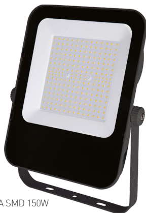
ALFA SMD 150W