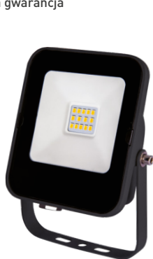
ALFA SMD 10W