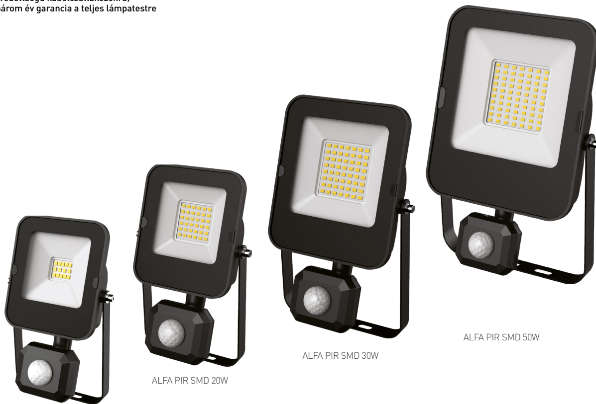
ALFA PIR SMD 10W