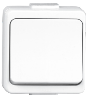
GXNP001, GXNP003, GXNP004, GXNP005, GXNP006