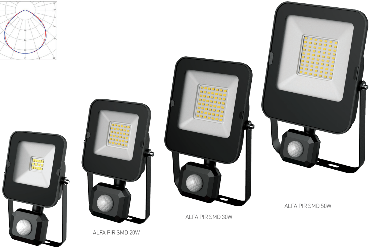
ALFA PIR SMD 10W